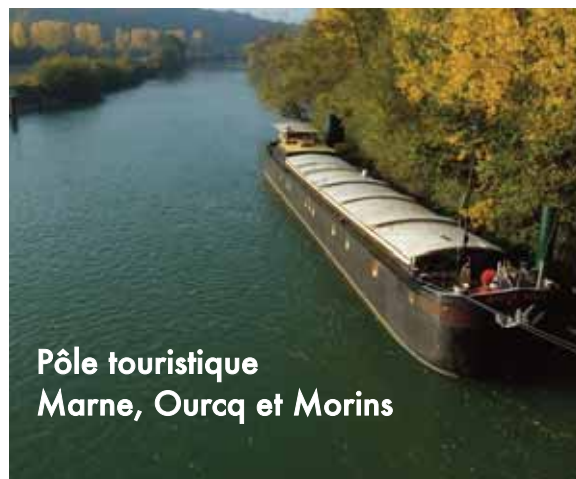
Pôle touristique Marne, Ourcq et Morins

La mission d'animation et de développement des pôles touristiques régionaux est confiée au Comité Départemental du Tourisme de Seine et Marne. Son rôle est d'apporter une aide au démarrage de projets, en appuyant les initiatives locales et départementales portées par des structures professionnelles publiques ou privées.