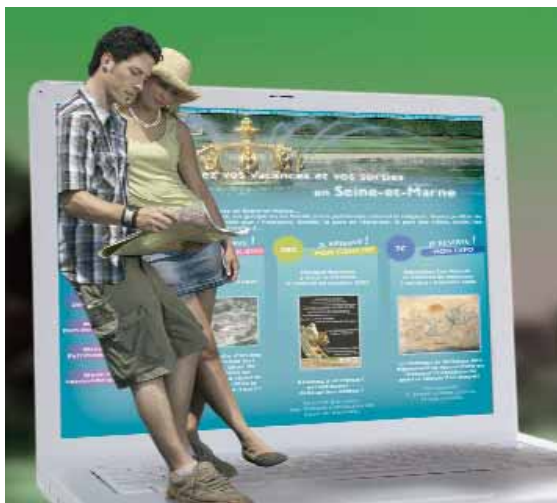
Le Tourisme de Seine-et-Marne sur la "toile" ...

Les nouvelles formes de communication peu consommatrices d'énergies et de ressources naturelles ont été plébiscitées par le Comité Départemental du Tourisme de Seine-et-Marne !