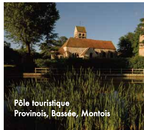
Pôle touristique Provinois, Bassée, Montois

En 2008 c'est un troisième pôle touristique régional qui a